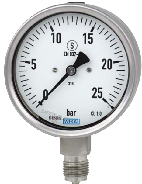
Манометр с трубкой Бурдона, модель 232.30

Диапазоны измерения: НР 63: от 0 ... 1 до 0 ... 1000 бар НР 100: от 0 ... 0.6 до 0 ... 1000 бар НР 160: от 0 ... 0.6 до 0 ... 1600 бар или все другие вакууметрические или мановакууметрические диапазоны по запросу.