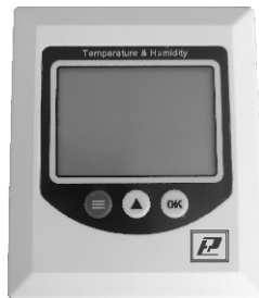
ПАСПОРТ И ИНСТРУКЦИЯ ПО ЭКСПЛУАТАЦИИ

Изготовитель ООО НПК «РЭЛСИБ» 630082 Россия, г. Новосибирск, ул. Дачная, 60 тел. +7 (383) 383-02-94, E-mail: tech@relsib.com